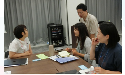
昨年のスクールの様子