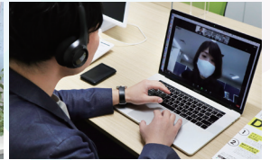
マッチング会(オンライン)

▼協働実績 これまでに多数の中小企業とデザイナーのマッチングが成立し、コラボ事例が生まれています。