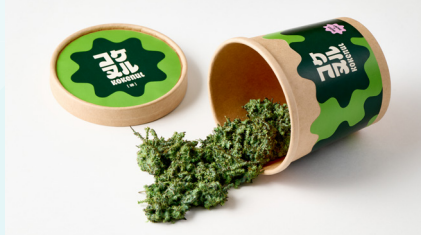
「コケヌル」 日研×ナリカタデザイン相談室