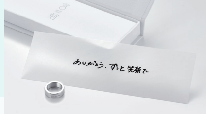
「言刻 -KOTOTOKI-」 ミュートック35×レベルフォーデザイン