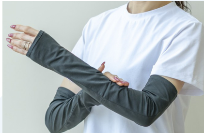
「冷やしトク」 フットマーク×オクノテ

▼協働実績 これまでに多数の中小企業とデザイナーのマッチングが成立し、コラボ事例が生まれています。