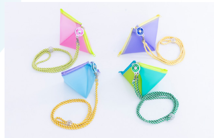
「TETO LALA (テトララ)」 紅日裁断×U.K Concept&Design