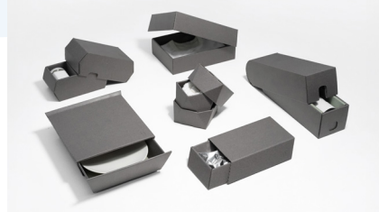
「BIX」 田中紙業 × soell