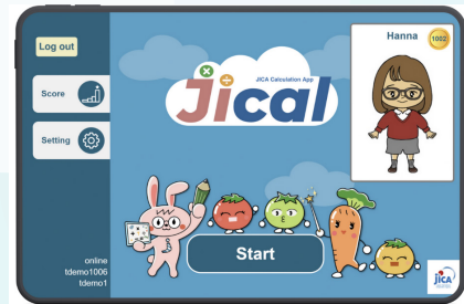
「JICAL (ジャイカル)」 ヘルスアンドテック×Hayabusa Design