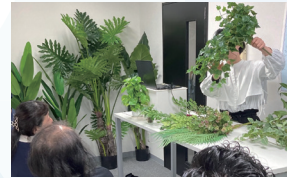
デザイナーへの説明会