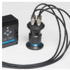
企画開発デザイン (工業用機械)