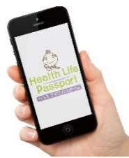
コミュニケーションデザイン (キャラクター・ロゴ)