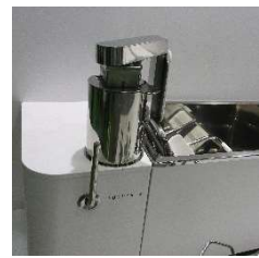
リ・デザイン (業務用製品の改良)