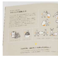
コミュニケーションデザイン (事業案内・カタログ)