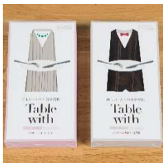
企画開発デザイン (商品開発・パッケージ)