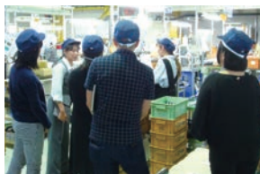
事業所・工場見学②