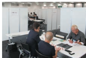
リアルマッチング会