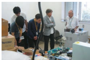
事業所・工場見学①