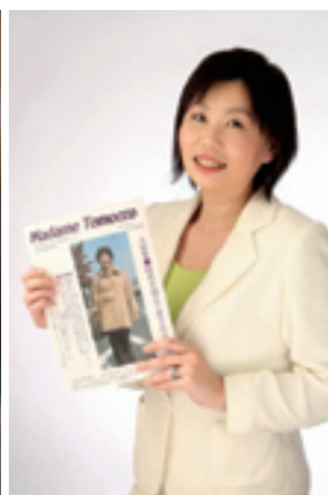
商品をプロデュース、販売するのは武石社長