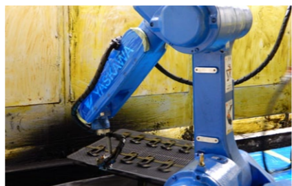
マグネシウム用化成処理工場及び塗装工場