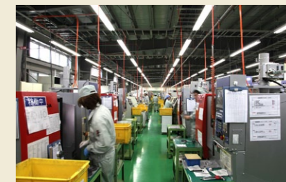
マグネシウム合金の加工専用工場