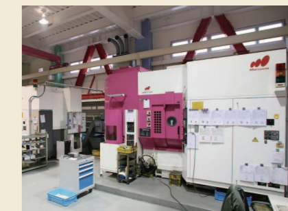
5軸マシニングセンタ