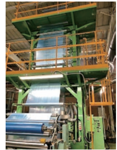
フィルム製造装置 (インフレーション成形)