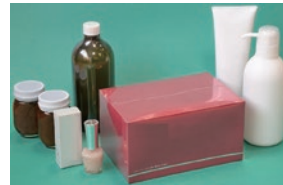
熱収縮フィルム (シュリンクフィルム)