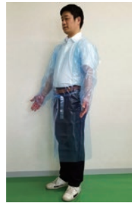
医療用ガウン (エプロン型防護服)