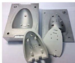
試作用簡易型とゴム製品