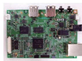
カスタム CPU ボード。LAN、USB、LVDS、I2C ほか。