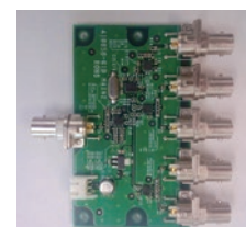
HD-SDI 信号分配器。1080p/3G 対応。