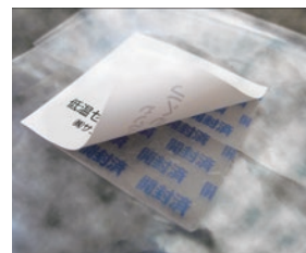
低温セキュリティラベル