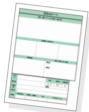
自社PRシート（イメージ図）

専門家と一緒に自社の「強み」「売り」を再発見し、ターゲット（お客様）に知って理解していただくためのシートです。企業概要、製品・技術の特長、画像を掲載できるフォーマットとなっています。