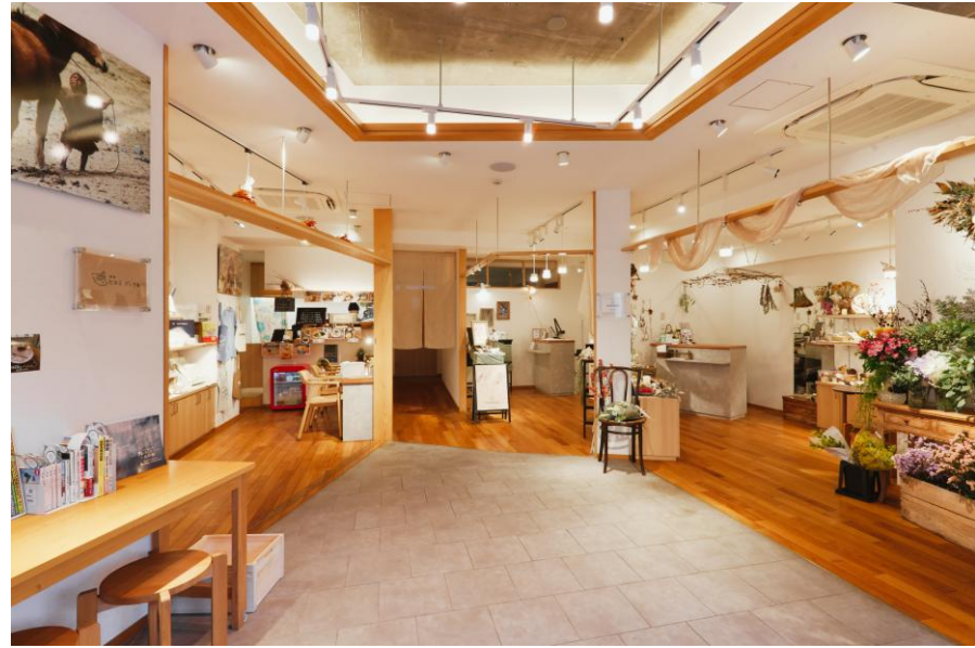
右：テナントA、中央：テナントB