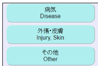
現状の画面（自社デザイン）