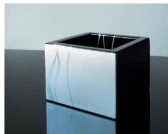
ステンレス製の枡