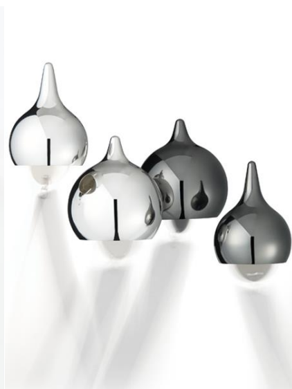
安次富氏が手掛けた作品より

モノがなかなか売れない成熟社会において、イノベーションをもたらす経営手法として注目されている「デザインマネジメント」。中小企業経営者がデザイン導入に取り組む際のポイントを探ります。