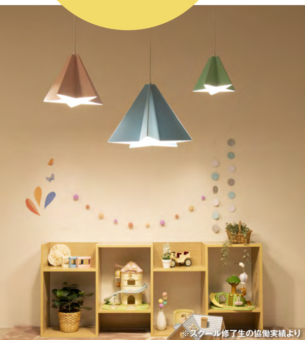
※スクール修了生の協働実績より

当講座では、最前線で活躍している講師からの実践的な学びを通じて、 「デザイン経営」を推進する「人財」を育成します