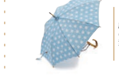
晴雨兼用おしゃれ洋傘 麻の葉

元々革細工のものづくりに携わっていたが、洋傘の技術に興味を持ち勉強を始める。現在、洋傘づくりは修行中ではあるが、お客様が満足するクオリティを目指し、鋭意研鑽を積んでいる。また完成される商品だけではなく、出来上がるまでのプロセスも大切に、量産化や段取りも視野に入れながら、一つひとつ工程を、誠意を持って取り組んでいる。