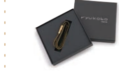
三重巻組紐プレスレット

家業である組紐に幼少期から親しんでいたが、組紐に装飾品としてだけでなく伸縮性や堅牢性など、和装の枠にとどまらない可能性を感じ、紐を組むだけでなく、企画・デザインも自ら行っている若き職人。有名ブランドのインステレーションや店舗装飾を手掛けるなど、江戸の粋な心と行動力で組紐の世界を広げる努力を続けている。