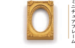
ミニチュアフレーム

学生時代は服飾デザイナーを目指していたが、様々な縁で額縁のものづくりに魅了される。現在は額縁職人として仕上げの作業を担当しながら、まだまだ知られていない額縁の魅力や伝えるべく、伝道師としての活動も並行して行う。額縁は作品を引き立てる黒子役だが、額縁だけでも奥深い魅力が詰まっていることを知ってもらえ、様々な動き回っている。