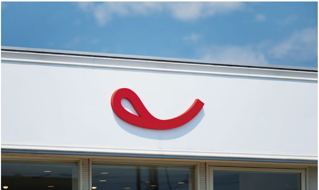
不二家洋菓子店 新ロゴ