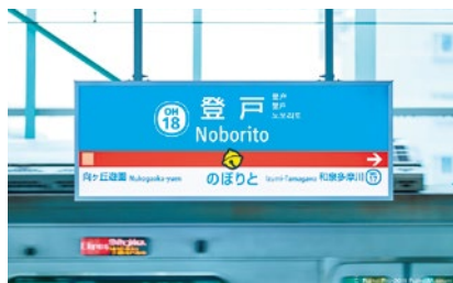
小田急線登戸駅ドラえもんサイン