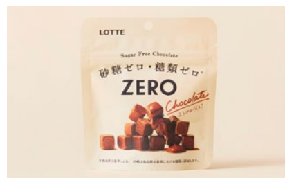
ロッテ「ZERO」パッケージリニューアル