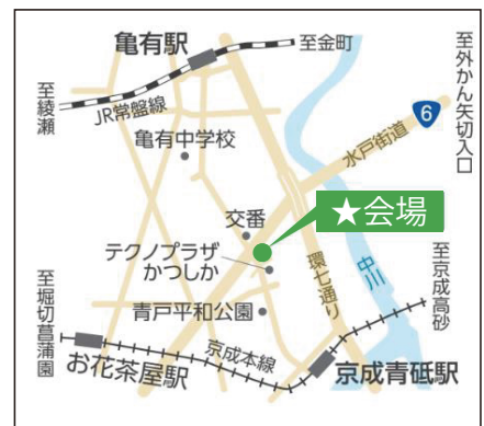
★東京都城東地域中小企業振興センター

都産技研城東支所は、都内城東地域の中小企業の“企画・設計から試作・加工、評価・性能試験まで”一貫したもののづくり技術支援を実施しています。特にプロダクトデザイン分野では企業の技術シーズや製品コンセプトをもとにデザイン開発から試作までを担当します。