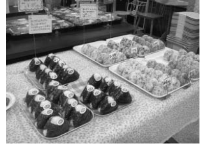
米のおいしさが伝わってくるおにぎり

コシヒカリなどの銘柄米だけにこだわらずに、「安全」で「美味しい」米を重視しているだけに、加藤商店で取扱う米は実に美味しい。加藤商店の隣に総菜やおにぎり、弁当などの販売店を別会社として兄弟で営んでいるが、地域の客の来店が絶えることなく、知る人ぞ知る「ご飯がおいしい惣菜・おにぎり屋」となっている。実際、この取材の当日は雨、しかも夕方であったが、客足は絶えなかった。筆者もおにぎりを4個買って食べたが、粘りとふっくらとした歯ごたえのある味で、50数年の人生のなかでこんな美味しいおにぎりを食べた記憶がない。この美味しさは加藤商店がめざす「安全」で「美味しい」米作りの結晶だといえる。