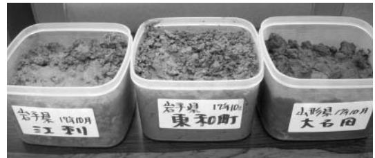
米作りに最適な粘土質の土