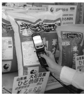
QRコードをカメラ付き携帯で読み取り、米の履歴を確認する

まず、田植え時に、生産者と作付けする米にあらかじめコード番号が割り当てられ、農薬や肥料の名称や使用回数、田植えや収穫の日程、農協への搬入量や日付など刈取りまでの基礎データが入力される。その後も産地農協では保管・出荷の詳細情報、運送会社では会社名や出荷先、数量などの流通情報、販売店では精米情報や出荷情報というように、米の移動や加工のたびに米