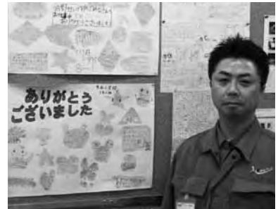
工場見学のあと小学生から送られた色紙

おいて社員教育をテーマにしていたことから、同氏の人材（雇用や教育）に対する熱意が感じられる。このように、自社の取引先だけではなく、地元にも感謝・還元すること