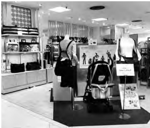
大手百貨店で企画展示を行い、販売している

ファッション性の高いものからシンプルで実用性のあるものまで、現在は多彩な製品が生まれている。