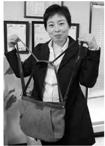
コアルーバッグの仕組みを解説して下さる池社長

池社長は公社の支援事業について「中小企業のどの経営段階においても、たくさんの支援メニューが準備されており、使い切れない位です」と話してくれた。「私自身が起業を考えていたときに公社に出会い、より積極的に公社の支援制度を利用していただろうと思うことがあった。今後も多くの起業者の助けになるよう、ベンチャー企業へも公社の存在をPRしてほしい」と励ましの言葉をいただいた。