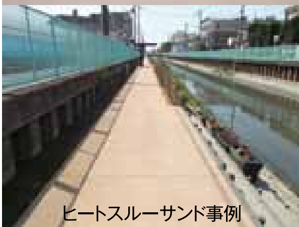
ヒートスルーサンド事例

遮熱デザインスプレーは、既設アスファルト面やコンクリート面に特殊型紙を貼付け、遮熱材料を吹付ける歩道系舗装技術であり、デザイン性と遮熱性に優れています。